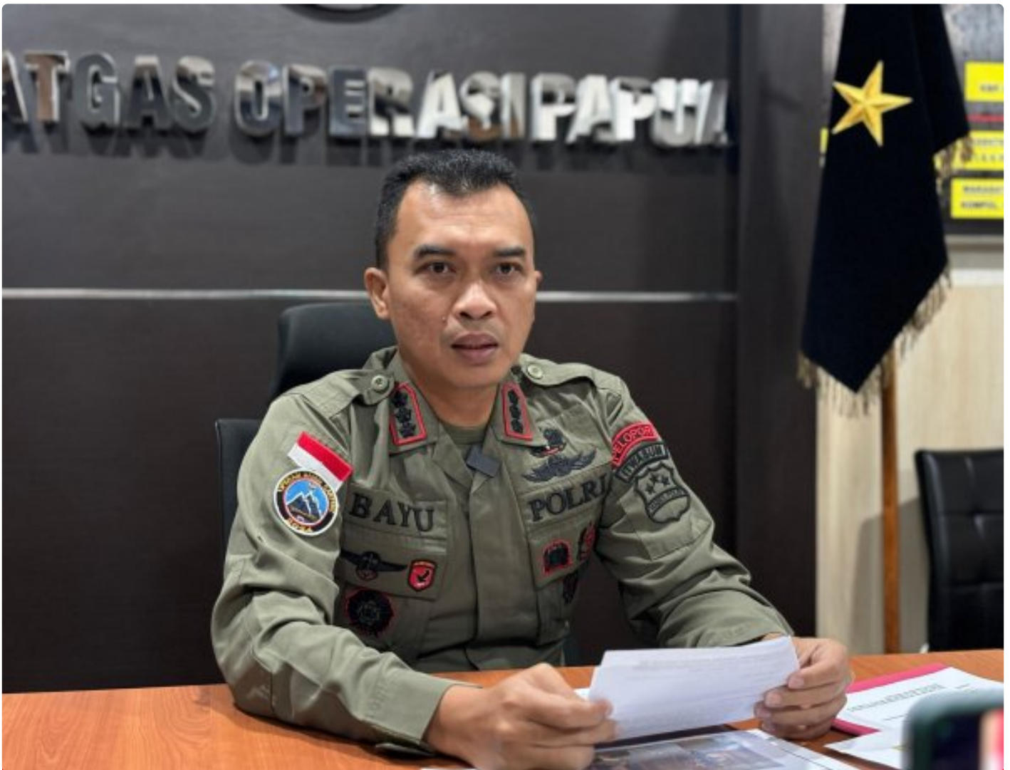
Bhayangkara